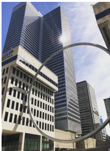
王の山の十字架(左)と聖母マリアの広場(Place Ville Marie)(右)